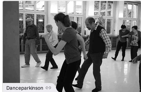
Dance for Parkinson - Ein Tanzkurs für Menschen mit Parkinson